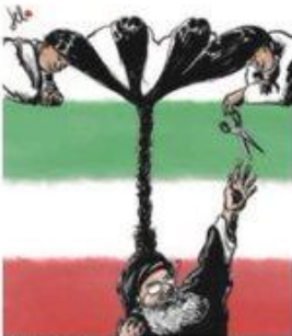
Del Rosso (Italie)