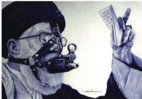
Elizavite (iranien réfugié en Turquie)