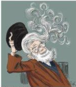
Esprit (dissidenteur français de 90)